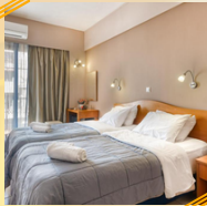
HOTEL DIROS (4 NIHGTS)

هذا السعر يشمل : الاقامة بالفنادق 5 أيام / 4 ليالي و الاقامة