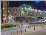
Hotel Gromada Warszawa Centrum Standard room room only (RO) Krakow